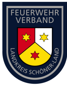
Abb. 2 – Muster Ärmelabzeichen Kreis- und Stadtfeuerwehrver-