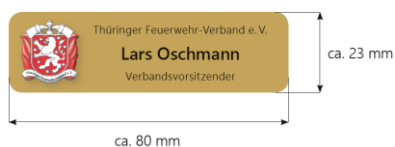
Abb. 1 – Muster Namensschild (ThFV)

An der rechten Brustseite kann ein Namensschild getragen werden.