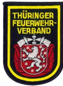
Abb. 3 – Ärmelabzeichen Thüringer Feuerwehr- Verband